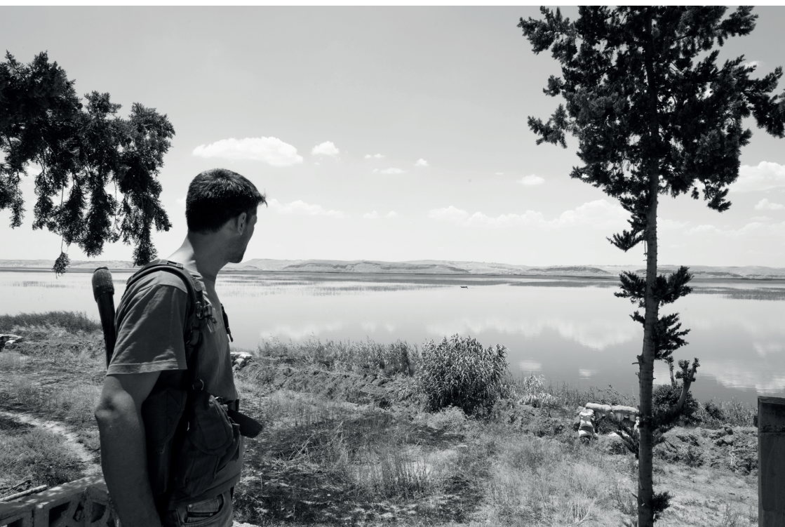
Un combatiente de las YPG en el Éufrates, cerca de Kobani. Julio 2015