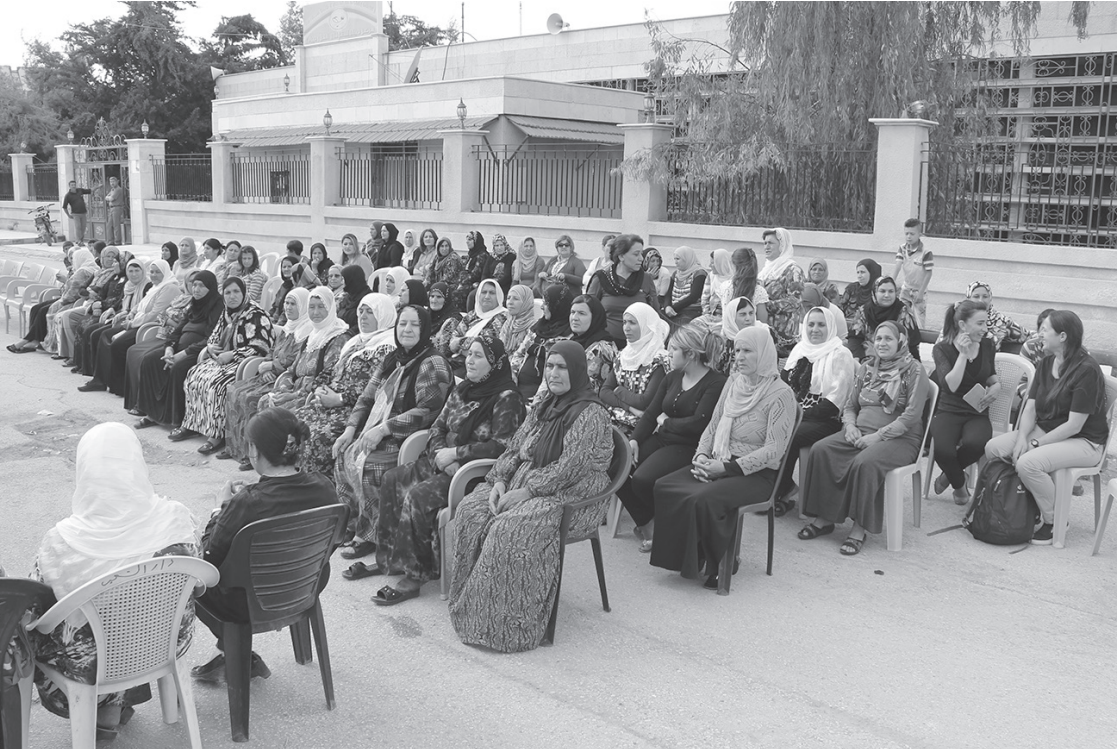
Asamblea de la Yekitiya Star en Derik