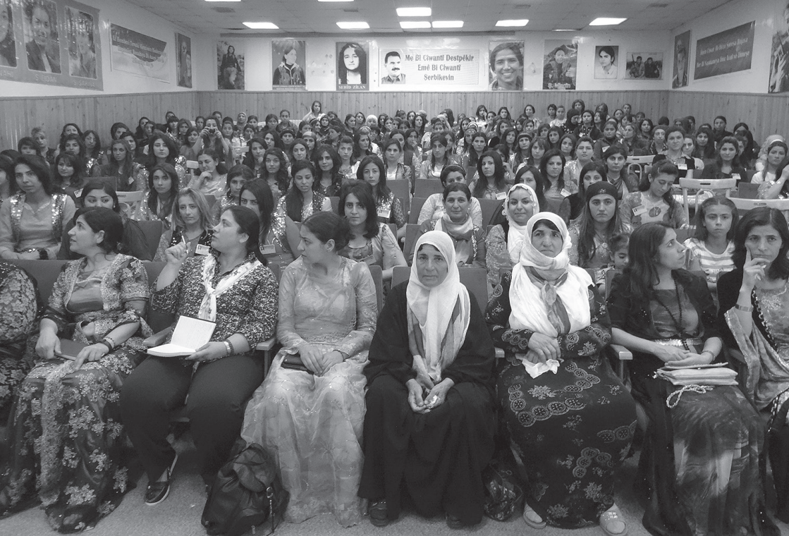
Conferencia de las Mujeres Revolucionarias Jóvenes de Rimmelan. Mayo de 2014