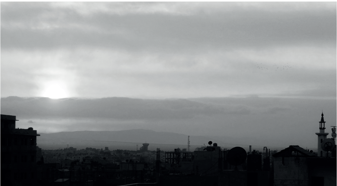
Puesta de sol en Heseê