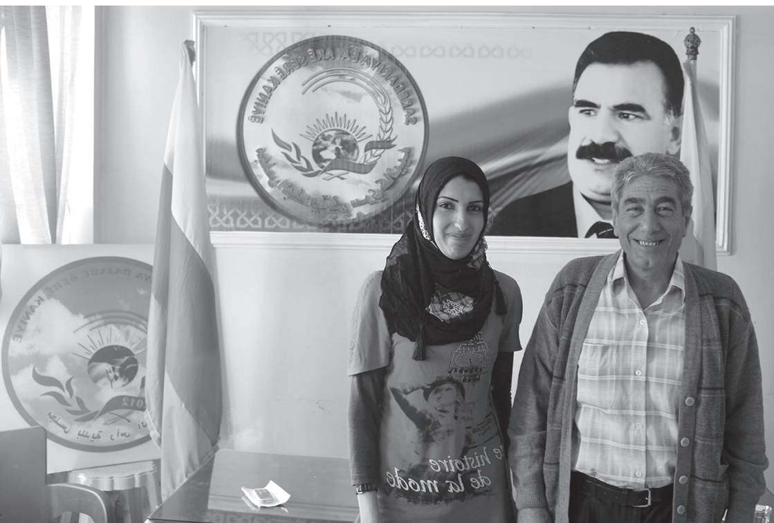
Ejemplo del principio de coliderazgo: coalcades de Serêkainyê

cumplía nunca. Nosotras no vamos a permitir de ninguna manera que esto se repita en nuestra revolución” 134 .