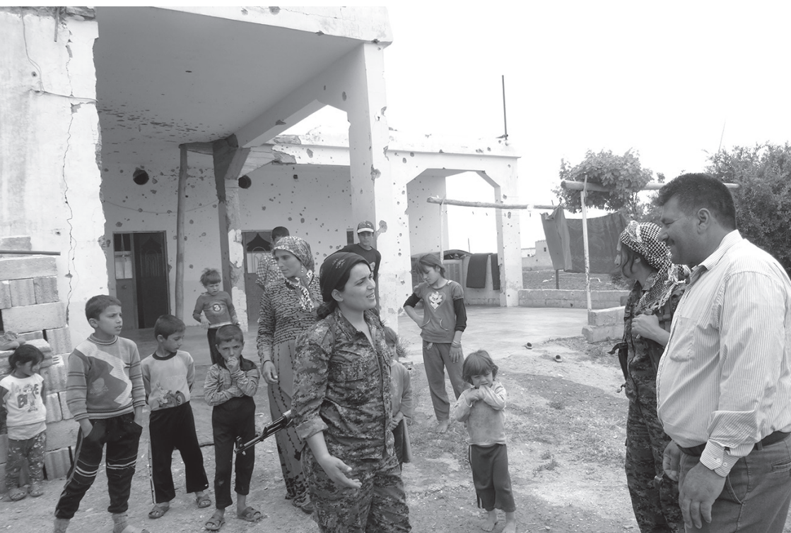
Pueblo destruido cerca de Til Xelef, sólo 20 días después que los residentes y las YPG/YPJ hayan liberado el pueblo. Mayo de 2014