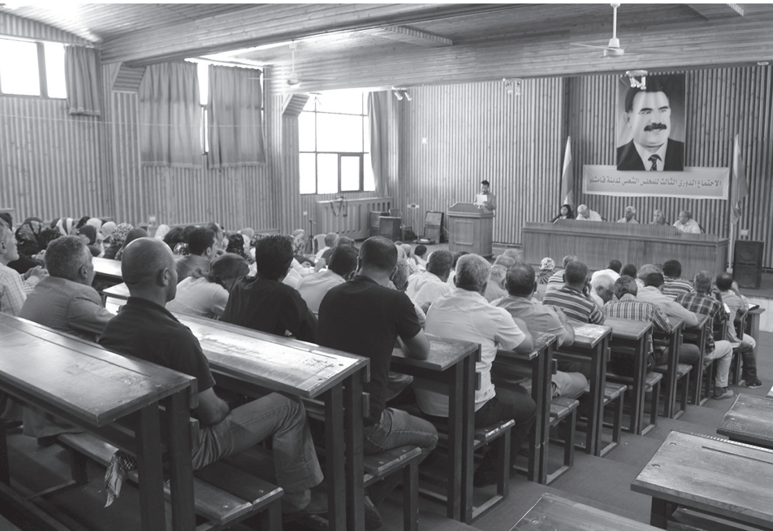
Consejo de la ciudad de Qamişlo