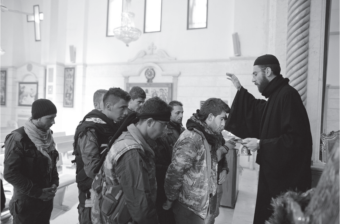
Combatientes del MFS bendecidos por un sacerdote, Navidad 2014 en Derik