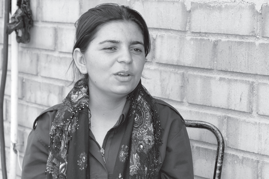
Comandante y combatiente de las YPJ en la Academia Şehid Jinda,