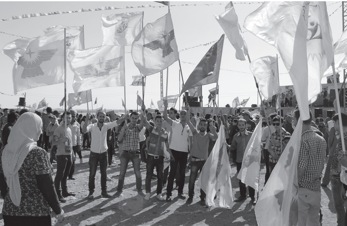
Población y organizaciones suryoye participan en la manifestación en protesta contra la zanja que el PDK construye para bloquear Rojava

La comunidad suryoye cuenta con sus propias fuerzas de seguridad, la Sutoro (en arameo, “defensa/seguridad”) 57 . En Octubre de 2014 todos los partidos suryoyes fueron convocados en Cizîre, donde acordaron una estrecha cooperación y convinieron en apoyar a la Sutoro y al Consejo Militar Siríaco (en inglés, Syriac Military Council), también la población caldea, que no había aprobado la creación de unas fuerzas de seguridad independientes.